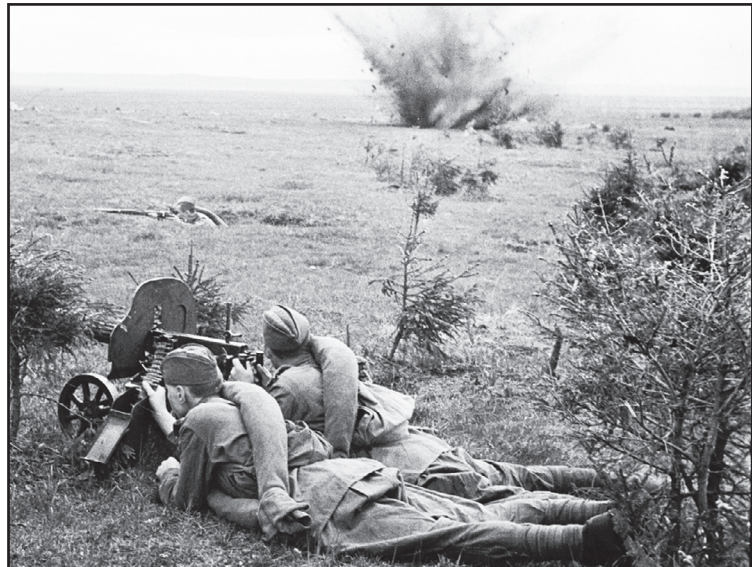
Битва за Смоленск

с. Агарак