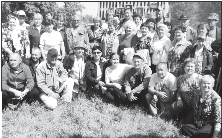
Встреча бучинцев в 2015 году