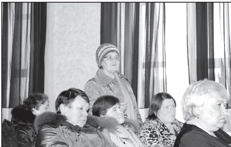
Выступления зональцев носили, скорее, рекомендательный характер