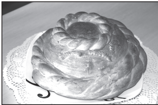
Каравай от ИП «Киришев А.В.»