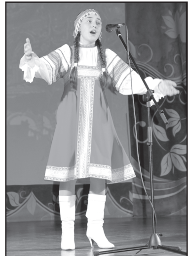
Вокалистка из Омутинского района