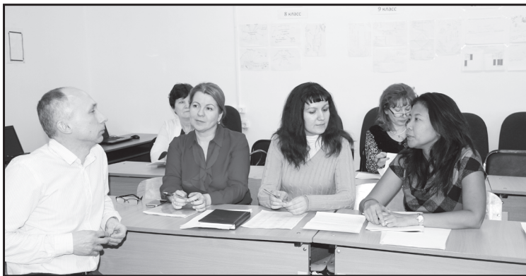
Анализ урока в МАОУ «Юргинская СОШ»

В работе семинара участвовали руководители проекта из Сингапура – страны, которая держит мировое лидерство в образовании. Состоялось знакомство тюменских педагогов с системой работы на уроке «ученик – ученик», «ученик – учебный материал». Данная система, считают руководители проекта, позволяет мотивировать школьников, вызывать интерес к изучению предмета. Для чего используются определённые мыслительные приёмы и структуры. Но при этом в любом приёме тесно переплетаются педагогика и психология. Участники семинара могли на собственном примере оценить работу в команде.