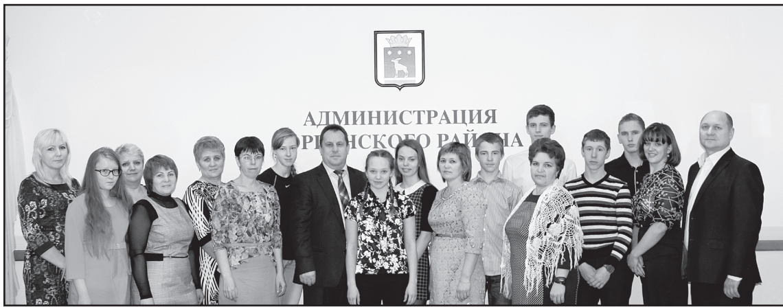
Торжественный приём главы района

В образовательных учреждениях района, сельских библиотеках и домах культуры состоялись праздничные мероприятия.