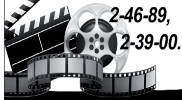
Фото- и видеосъёмка

2-46-89, 2-39-00. УСЛУГИ ФОТО- И ВИДЕОСЪЁМКИ семейных торжеств, детских утренников; РЕТУШИРОВАНИЕ (ВОССТАНОВЛЕНИЕ) ФОТОГРАФИЙ; МОНТАЖ ВИДЕОРОЛИКОВ. Профессиональное оборудование, творческий подход, низкие цены.