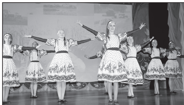
Танец – в подарок

Награды департамента агрокомплекса области, главы района. До восьмидесяти человек отмечены были на торжественном