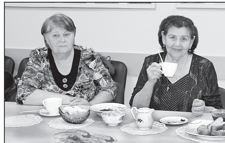
Дегустация продукции ООО «Восток»