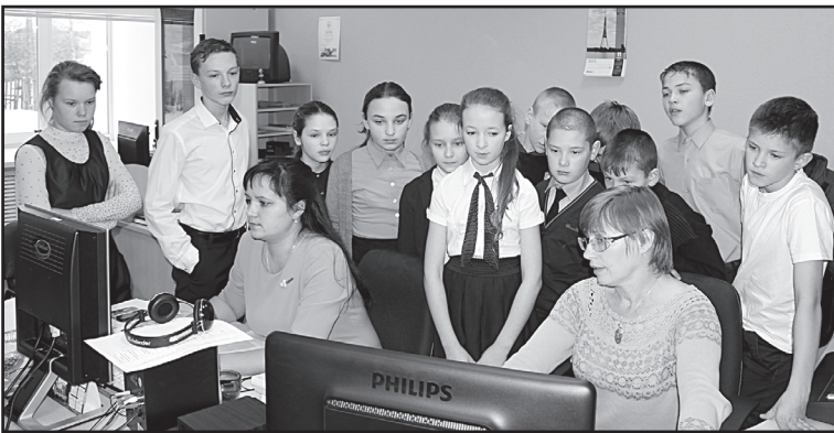
Экскурсия на телестудию «ТВ-Юрга»

Презентовало продукцию ООО «Восток». «Местный продукт» – так назвали мы нашу выставку в рамках областной