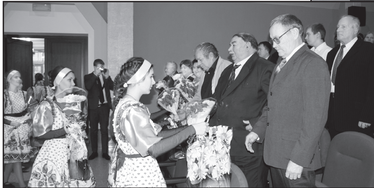
Цветы – ветеранам сельхозпроизводства