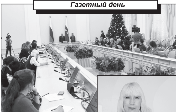
На встрече с представителями СМИ в правительстве Тюменской области

На конкурс «Герои эпохи» было прислано более 270 работ от 27 редакций городских, районных, областных и северных СМИ.