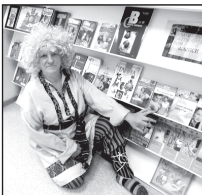
В библиотеках района