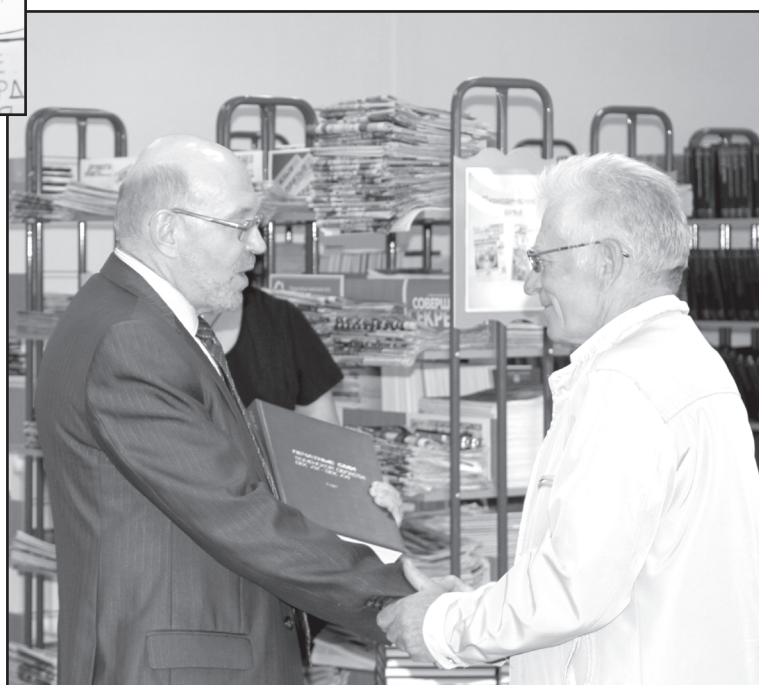
Энциклопедическое издание – в подарок

лива. Если для спецов городских изданий 2000 строк в месяц – подвиг, районные газетчики делают до 5000. Они из категории шведов-жнецов. Осилят любую тему. Правда, будем объективны, из-за захлестывающего газетного вала яркие, глубокие аналитические материалы встречаются реже, чем хотелось бы. Тем не менее по оценке наших гостей-профессионалов высокого класса, материалы Юргинской районной газеты бывают достаточно сильными, добиваются признания жюри в областных конкурсах профессионального мастерства.