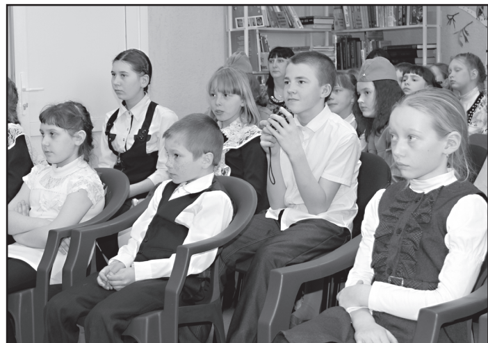
Библиотека выполняет функцию коммуникационной площадки для организации культурного досуга детей