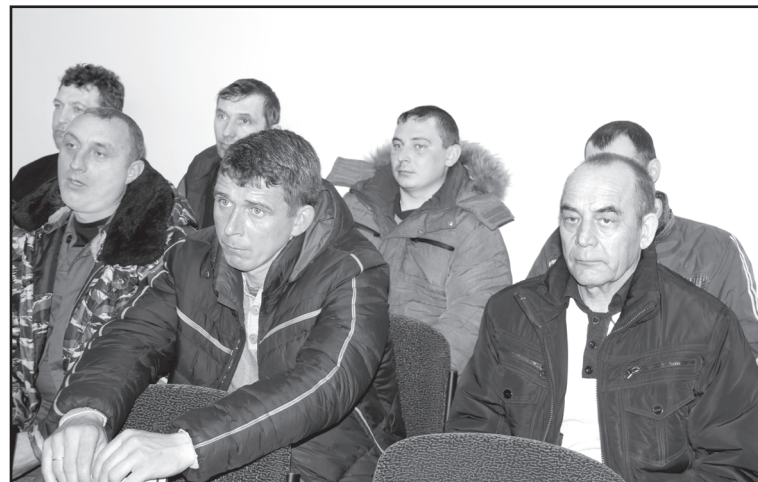
На сходе в с. Лесное