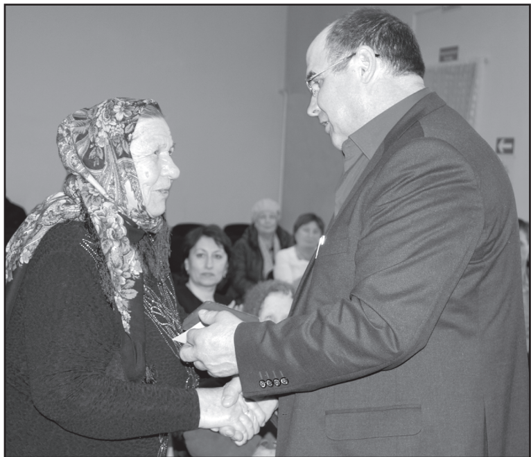
Вручение памятных медалей «70 лет Победы в Великой Отечественной войне 1941–1945 годов»