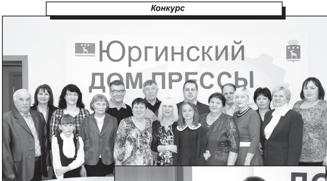
Общая фотография на память

Не только об истории родного края рассказывают авторские работы, – о сегодняшнем дне района, его предприятиях и людях. В номинации «Люди дела