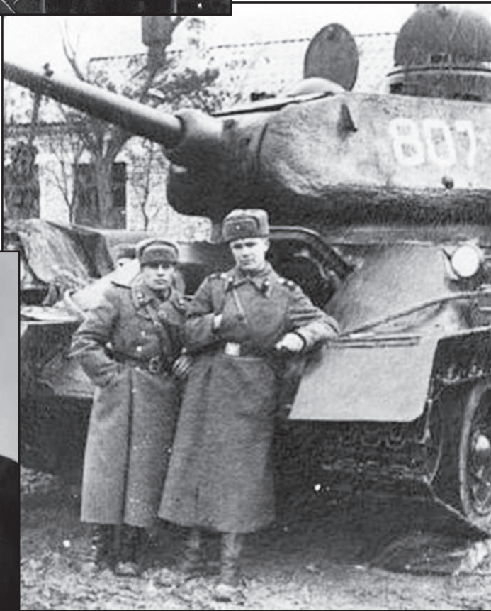
Александр. Фронтовыми дорогами