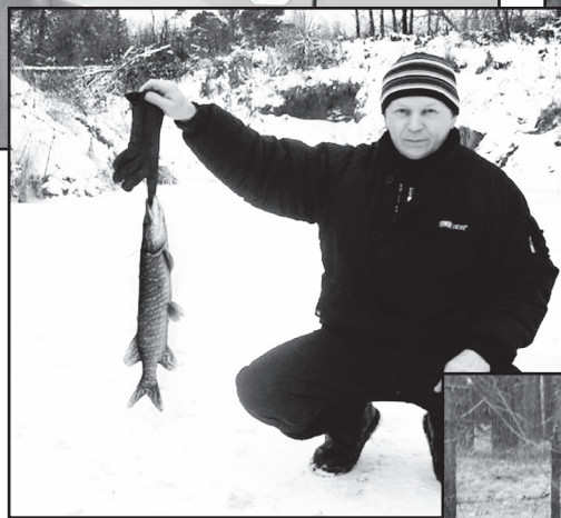
В свободное от работы время

– Я человек не публичный, – признаётся он. И с присущей