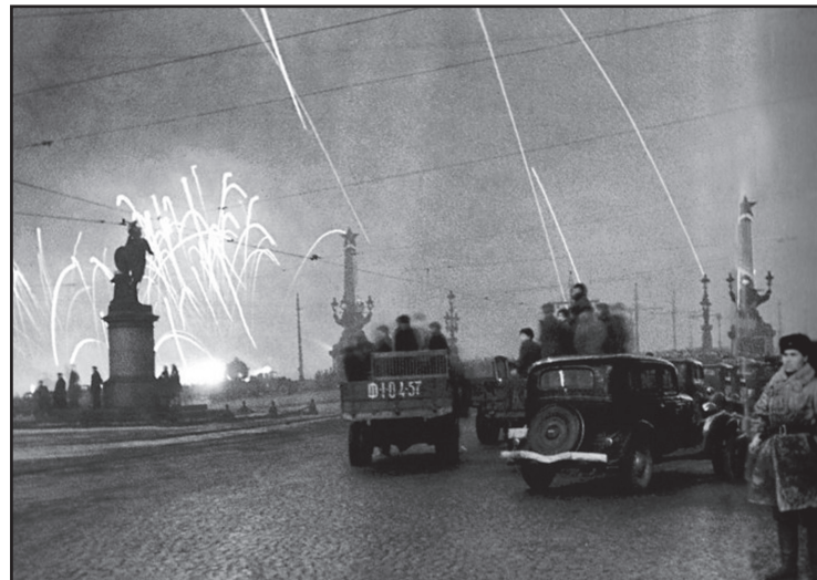
Ленинградцы на Суворовской площади смотрят салют в ознаменование снятия блокады

http://www.lugacity.ru Фото с сайта http://topwar.ru