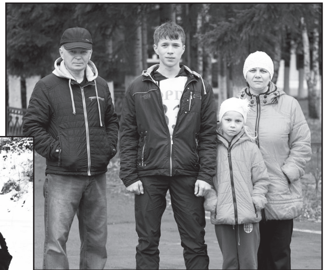
На день здоровья – всей семьёй