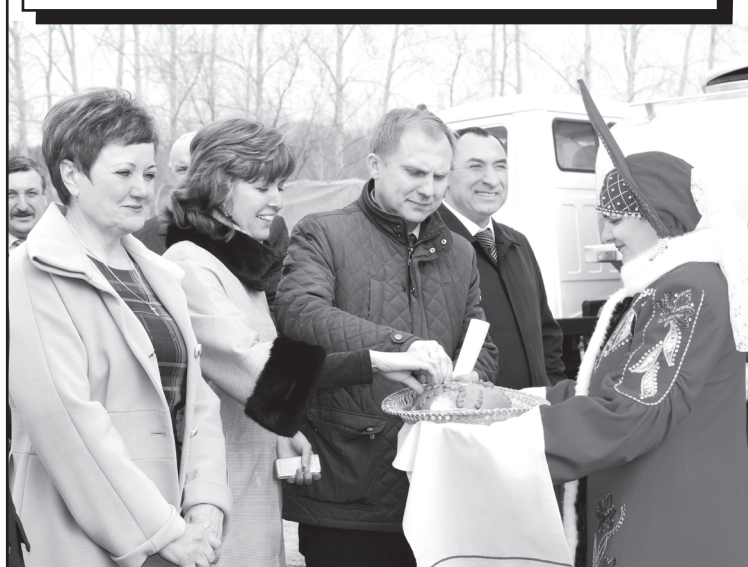
Открытие цеха по переработке молока в с. Юргинское