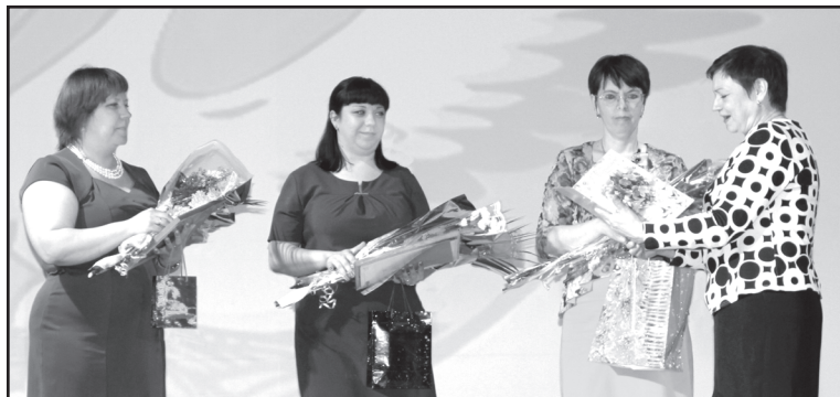
Поздравления принимают участники конкурса в номинации «Педагог дополнительного образования»