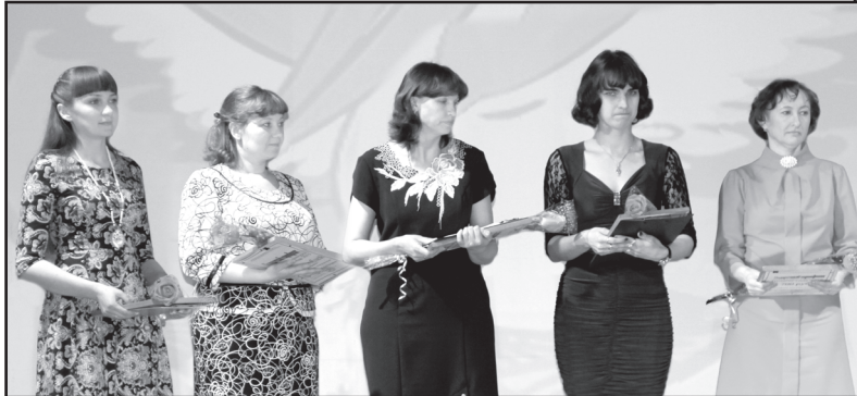
Номинация «Воспитатель года»

Путь к финалу – время значимой, ответственной и увлекательной работы, которую невозможно представить без творческих идей, исследований, практического воплощения теории. В конце этого пути – церемония награждения. О