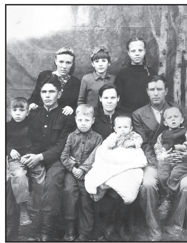
В кругу родных

Когда я пошла в первый класс, мама перешла на меня своё пальто. У меня его украли. Выдали фуфайку, укоротив рукава. Подвязав фуфайку поясом, ходи-