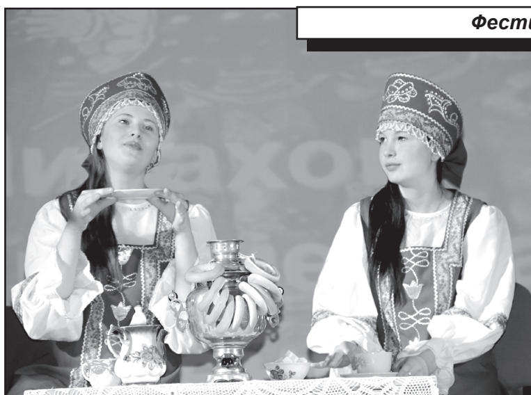
Коллектив «Затяя» из с. Агарак

— Фестиваль детского творчества – это праздник, который дарит хорошее настроение. К нему причастны практически все, кто сидит сейчас в зрительном зале: участники конкурса, их руководители, родители и друзья. Спасибо всем, кто сегодня здесь. Особые слова благодарности организаторам, которые трепетно относятся к подобным мероприятиям, жюри, которому пришлось делать нелёгкий выбор, определяя лучших из